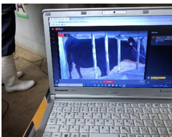
ICTを活用し様子を観察

今年度の新たな取り組みとして繁殖牛の分娩の様子をICTを活用して観察しました。その成果もあって3月17日に無事子牛が生まれ順調に成育しています。