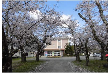
校門の桜も満開（4/15撮影）