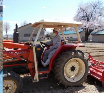
圃場準備(専攻生3年)