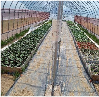
販売を待つ野菜苗

是非、この機会にご購入いただきたいと思います。 ※耶麻農ホームページに苗一覧表を掲載しました。