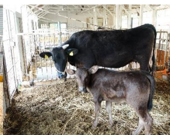
生後1か月後の母子牛