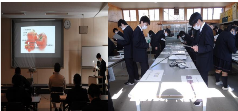
校内プロジェクト発表会

現在、コロナの影響により、各種大会の実施が未定の部分がありますが、いつでも対応できるように準備していきたいと思っています。