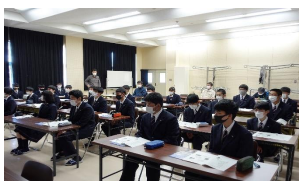
農業クラブオリエンテーション