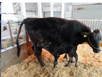
出産直後の母子牛