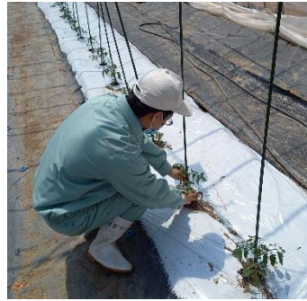
トマトの定植作業