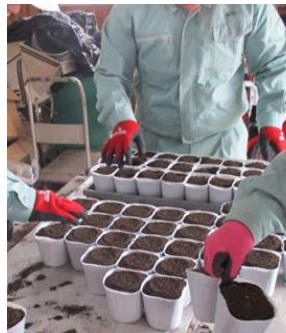
野菜苗は種準備中