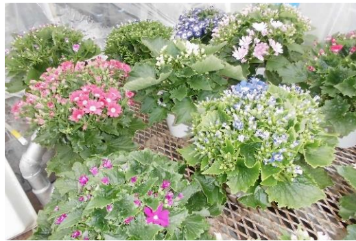
サイネリア販売中