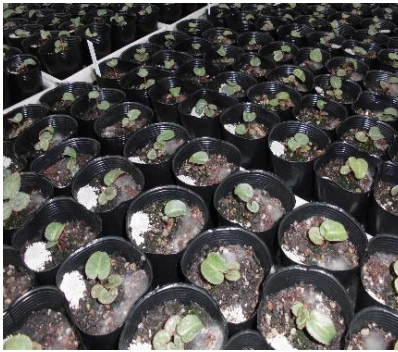
来年のシクラメンの苗

今年度も多くの方々に、草花（シクラメン等）を購入いただきました。ありがとうございました。現在は、来春の花壇苗（ペゴニア・カンナ等）の、は種・育苗真っ只中です。予定どおり順調に生育中です。次年度も、地域の方々に喜んでもらえるように頑張ります。