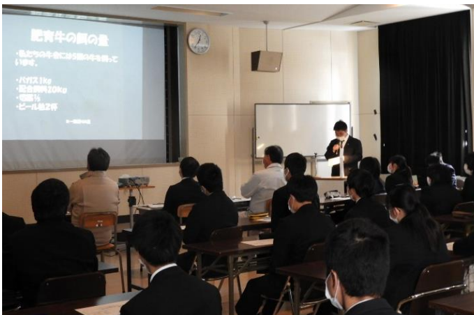
校内研究発表会（3学年）

校内研究発表会は、大雪による列車運休の影響があり、3年生が1月20日、2年生は2月9日と別日に実施しました。3年生の発表は全学年聞くことができました。1年間、2年間の研究の成果をパワーポイントにしっかりとまとめ、多くの人の前で、堂々と発表をしてくれました。