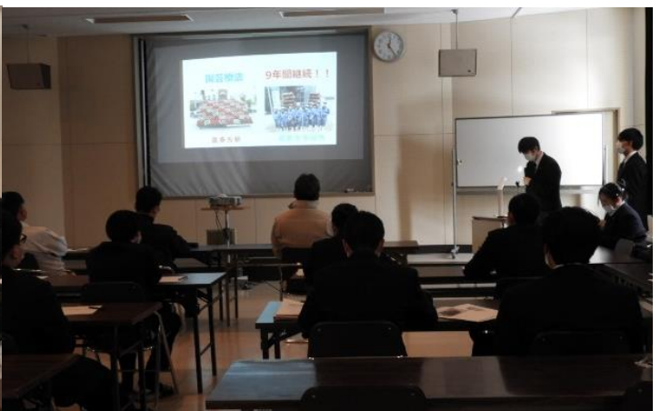
校内研究発表会（2学年）