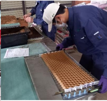
ネギ チェーンポット準備中