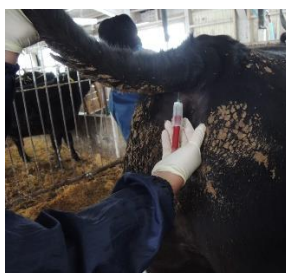
ビタミン検査(採血)