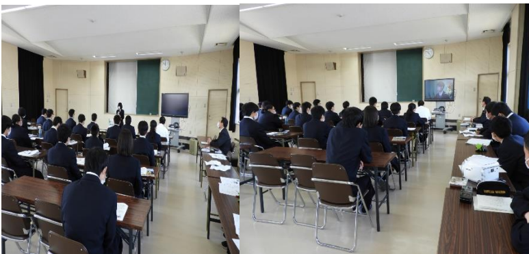
農業クラブオリエンテーションの様子

現在、コロナ関係の影響により、各種大会の校内予選や県大会等の実施が分からない部分がありますが、いつでも対応できるように準備していきたいと思います。