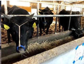
順調に生育しています