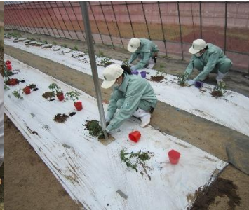
1年生初めての実習