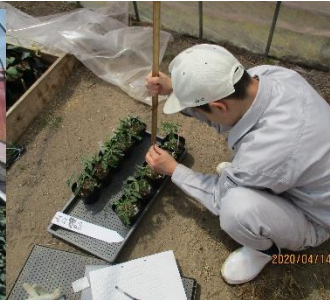
生徒の研究も始まりました