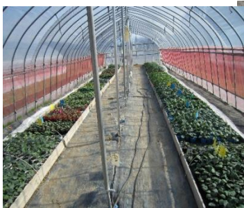
販売を待つ野菜苗