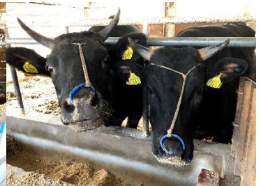
笑顔で撮れました