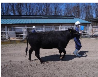
担当の牛を体重測定

本年度の生産計画は、肥育部門では、現在9頭肥育しており、5月に3頭出荷する予定です。2週間に1回の体重 調査をおこなったところ、雌で810kgと順調に生育しています。昨年地元スーパーで本校の肥育牛が販売され大好評 でした。今年度も皆様に提供できる体制をとっていききたいと思います。