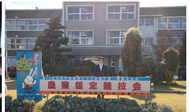
令和元年度農業クラブ全国大会