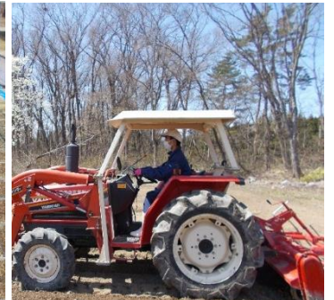
圃場準備（専攻生3年）