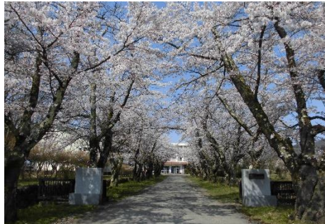
校門の桜も満開（4/22撮影）

今年度もミニ文化祭（10月）にお いて農産物販売・そば店の出店を行う予 定です。耶麻農業高校の諸活動をご理 解の上、応援の程、よろしくお願い致しま す。