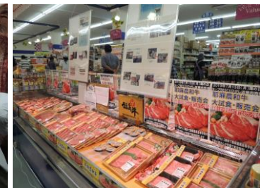
6次化の取組み(牛肉販売)