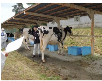
家畜審査競技の様子

本年度の生産については、肉牛部門では全頭が最高ランクのA5等級を肥育することができました。またセリ値最高をつけたものもあり近年肉質の良いものを出荷することができました。学習成果では、県の家畜審査競技大会3名が優秀賞をいただきました。プロジェクト発表では、3年生・2年生が1年間取り組んだ調査研究をまとめ、校内研究発表も頑張りました。これからも継続研究し良い結果を出せるよう頑張りたいと思えます。