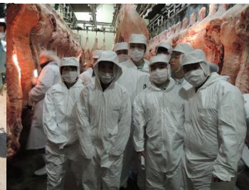
セリの見学(郡山市)