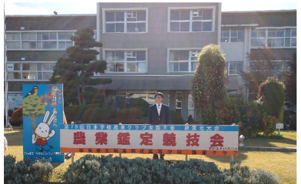
令和元年度農業クラブ全国大会