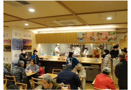
東京日本橋でも大盛況