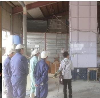
JGAP審査の様子(9月実施)