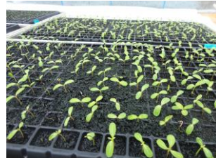
ニチニチソウの苗