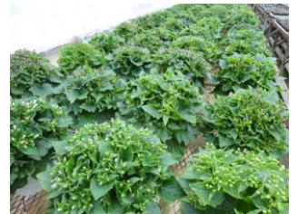
シネリアは販売中