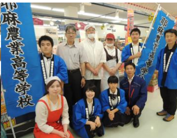
COOP BESTA ひがし店の 皆さんと撮影