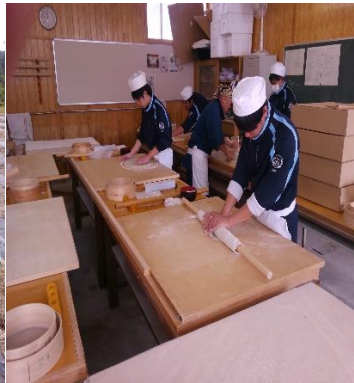
蕎麦打ち講習会の様子