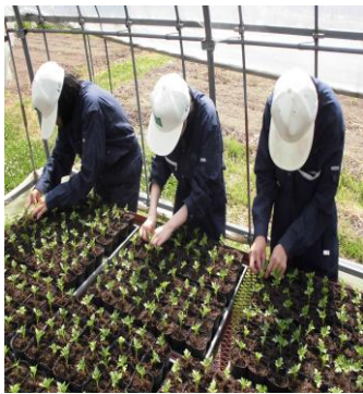
ポット上げの作業

なお、今年も多く地区や学校等で草花苗を購入いただきありがとうございました。11月頃からは、シクラメンの販売を行いますので、よろしくお願ひします。