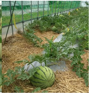
7月下旬から収穫予定のスイカ