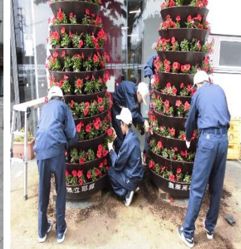
花のタワー作成中