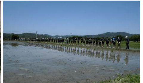
全校一斉田植え、全生徒スタート前