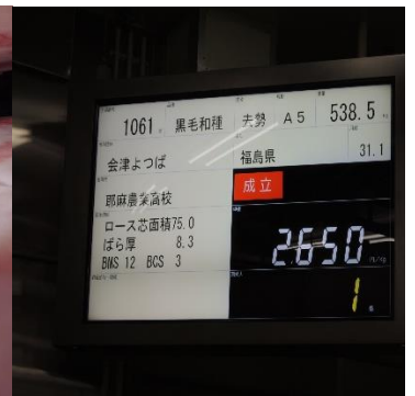
セリ当日の最高値