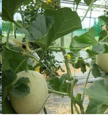
8月中旬収穫予定のメロン