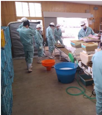
水稻播種作業の様子

作物部門は今年度、水稻（コシヒカリ）、そば（会津のかおり）、サツマイモ（紅はるか）の栽培を予定しています。2・3年生は課題研究の中で、そば打ち技能習得に向けて、年16時間の外部講師による蕎麦打ち講習会を受講したり、各作物の生育や品種比較試験栽培などに取り組んだりする予定です。昨年度は、穀物（玄米）でのJGAP認証を取得しました。整備された施設をぜひ見学に来てください。