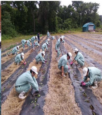
サツマイモ定植の様子