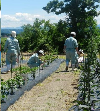
課題研究に励む生徒