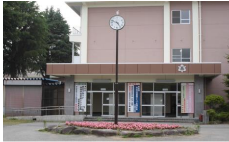
野外時計（70周年記念事業）

なお、山都新そば祭りにも参加しますので、楽しみにしていただきたいと思ます。お待ちしております。