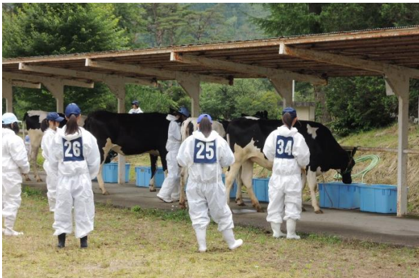
乳用牛の部の競技様子

6月13、14日に意見研究発表県大会が相馬農業高校で、7月3、4日に農業情報処理競技が福島明成高校で開催され、2名の生徒が参加しました。7月31、8月1日には福島明成高校で開催される農業鑑定競技に5名の生徒が参加してきます。