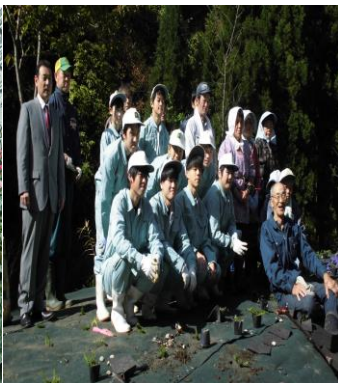
宮古地区の方と芝桜植え