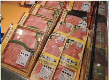
きれいにパッケージされ販売