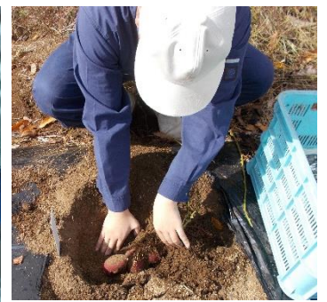
調査株(サツマイモ)の収穫