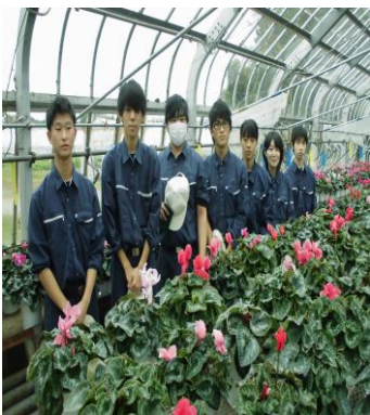
今年もシクラメンは順調

これからは、シネリアを2月下旬から販売する予定ですので、よかったですら温室にお越しただければと思います。