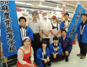
COOP BESTA ひがし店の 皆さんと撮影