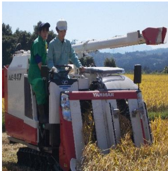
コンバイン操縦中