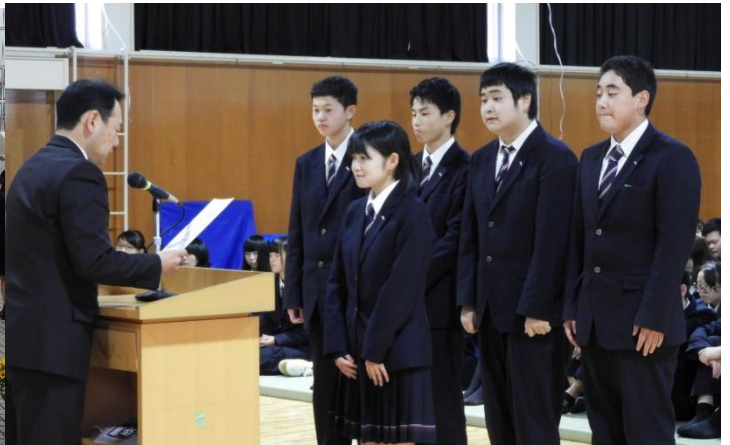
新役員任命式の様子