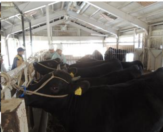
導入した子牛も順調に生育