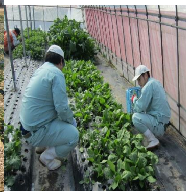
ハウス内での収穫作業