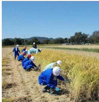
山都小との稲刈り作業