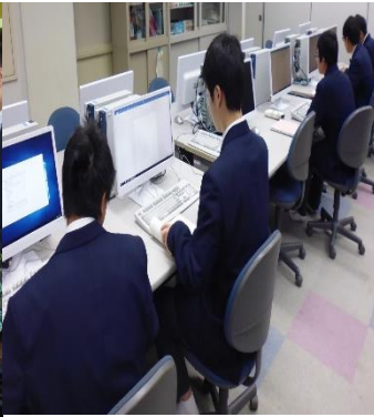
課題研究のまとめ