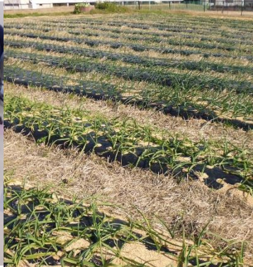
ニンニク・タマネギ畑