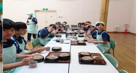
そば打ち体験後の試食会