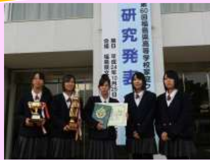
県大会 最優秀賞 ～福島市 10/25・26日～