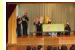
●3年 「3年間 施設実習 ありがとうございました」