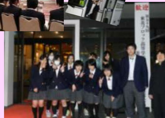
東北大会 優秀賞 ～岩手県花巻市 12/15・16日～